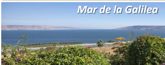
Mar de la Galilea

UNIVERSIDAD CATÓLICA de Colombia Vigilada Mineducación