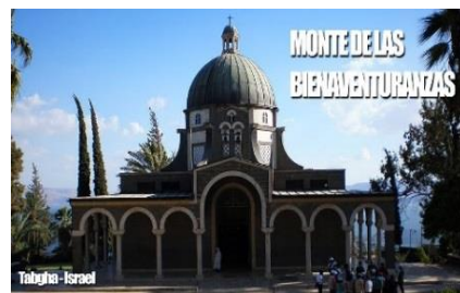
MONTE DE LAS BIENAVENTURANZAS

Desayuno. Salimos a Cafarnaum, visita de la sinagoga, lugar donde Jesús proclamó la palabra del pan de vida dirigida a los judíos incrédulos y la casa de Pedro. Tabgha, "la multiplicación de los panes y peces". Luego subimos al Monte de las Bienaventuranzas. Celebración de la Eucaristía. Almuerzo. En la tarde, paseo en barco por el Mar de Galilea. Visita de Magdala, la Iglesia en honor a María Magdalena. Regreso al hotel en Nazaret. Cena