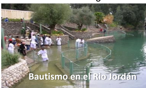
Bautismo en el Río Jordán