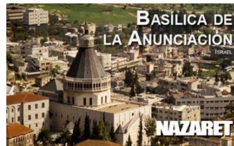
BASÍLICA DE LA ANUNCIACIÓN

Desayuno. Salida hacia Cesaréa marítima para visitar el teatro romano, la ciudad cruzada y el acueducto. Se sigue a Haifa. Vista panorámica del Santuario Bahai y los Jardines Persas. Continuamos hacia la cima del Monte Carmel para visitar el Monasterio Carmelita. Celebración de la Eucaristía. Almuerzo. Seguimos a San Juan de Acre para apreciar las fortificaciones medievales. Finalmente por las montañas de Galilea hasta Nazareth. Cena y Alojamiento en Nazaret.