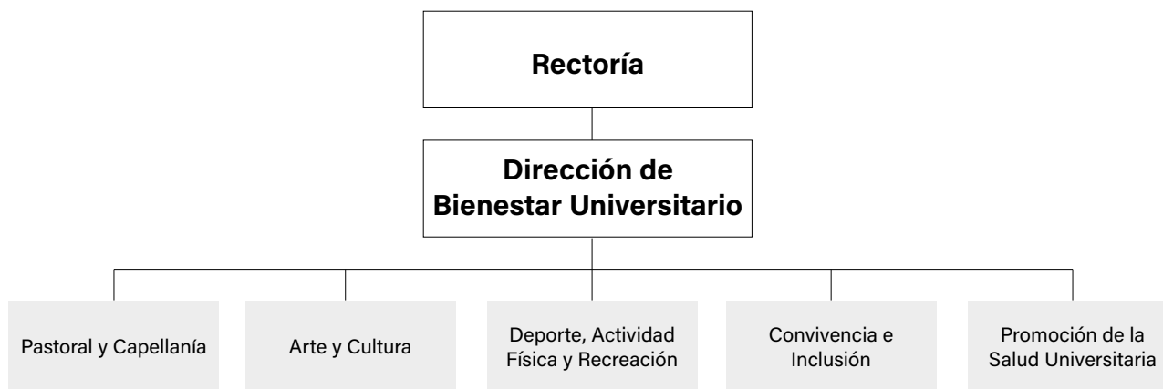
Figura 1. Estructura organizacional de Bienestar Universitario