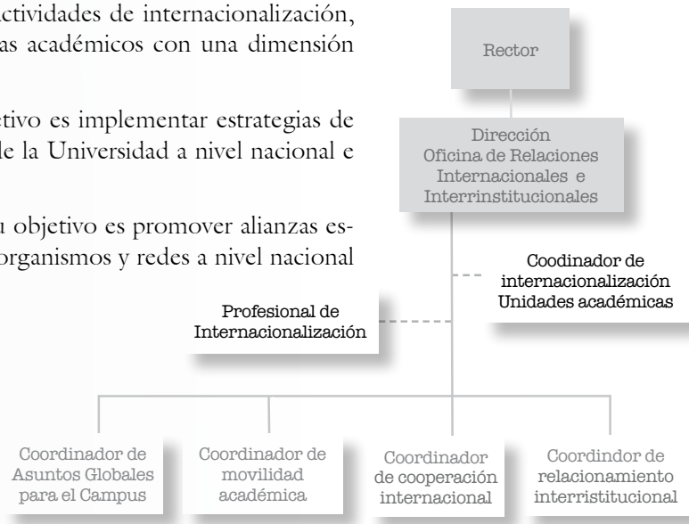
Figura 1. Estructura funcional de la internacionalización en la Universidad Católica de Colombia