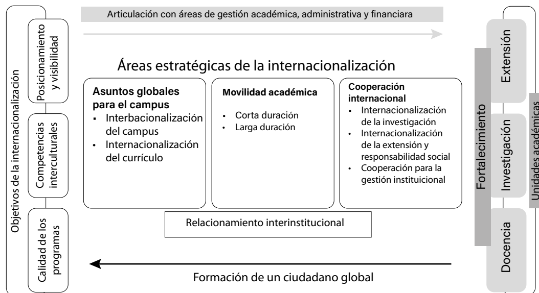
Figura 2. Internacionalización de la Universidad Católica de Colombia