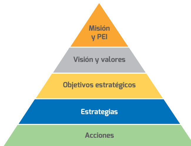
Figura 1. Estructura del Plan de Desarrollo

Para el logro de nuestra visión, se definieron seis Objetivos Estratégicos y para cada uno de ellos, estrategias que focalizan las acciones que se deben realizar durante la vigencia del plan. (Figura 1)