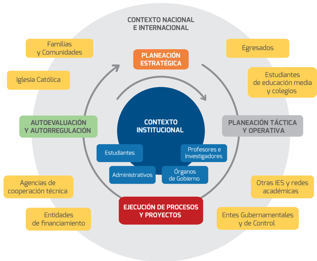
Figura 4. Ciclo de integración estratégica, táctica y operativa

Este tipo de gestión fortalece la integración táctica, operativa y estratégica, que soportada por una cultura y procesos de autoevaluación y autorregulación, permite aumentar la capacidad institucional de respuesta frente a los requerimientos presentados por los diferentes públicos de interés internos y externos (Figura 4).