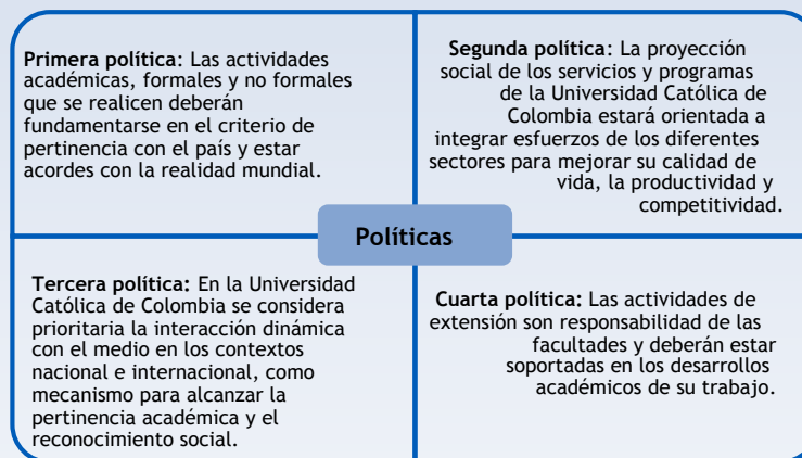
Figura 1. Políticas institucionales para la proyección social en la Universidad Católica de Colombia según el PEI